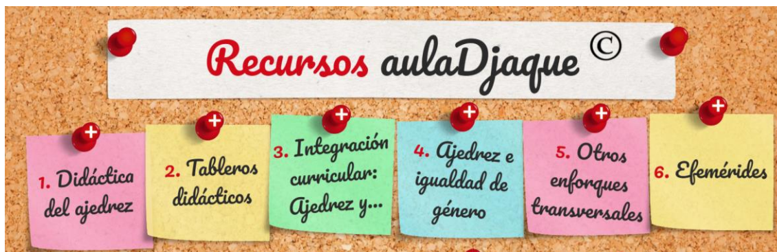
Sección de recursos de la web aulaDjaque