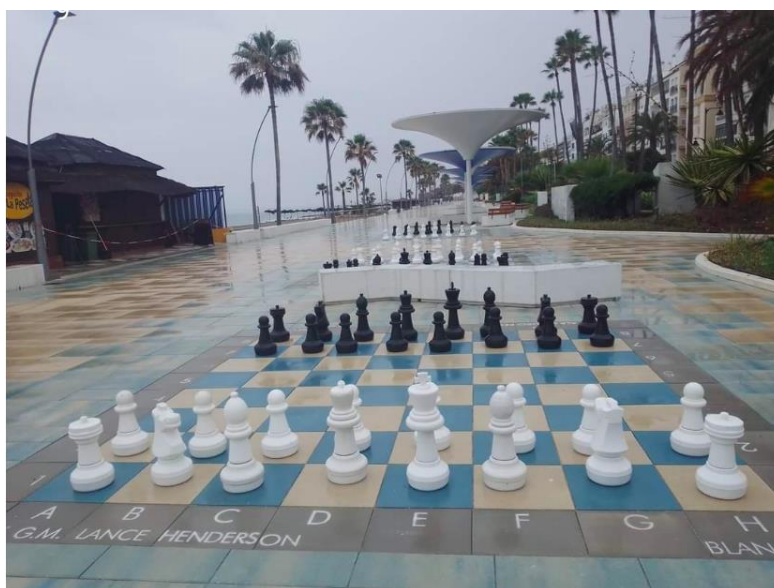
Paseo Marítimo de Estepona

Nuestro centro está en una localidad en el que desde hace años se fomenta el juego del ajedrez. A través de clubes y la escuela municipal, Estepona tiene este juego muy presente, ya que el recorrido de los últimos años desde los colegios ha mostrado las bondades de su práctica en nuestros jóvenes.